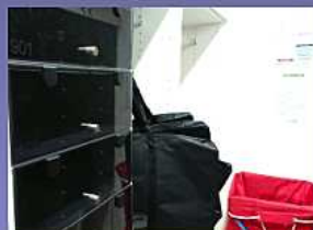
クリーニング取次ぎ